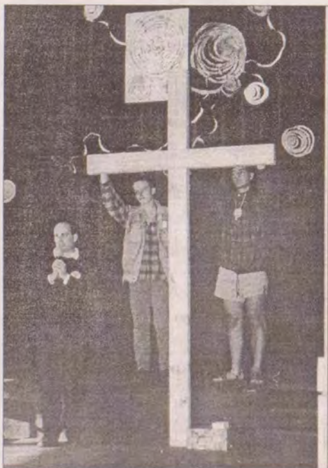
Dobrovolníci u kříže

V kulturním domě nás v poledne očekává vynikající svíčková - českolipská pohostinnost nezklamala. V čase polední siesty se v sále koná folkový koncert písničkářky Evy a mezitím o pár metrů dál odpovídá otec biskup Josef na otázky tým, kterým nestačil ranní křížový výslech.