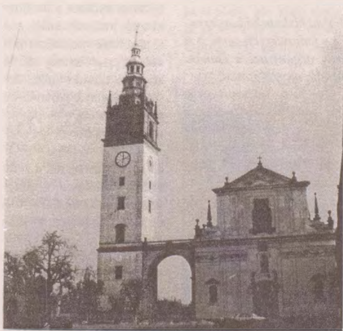
Katedrála sv. Štěpána, prvomučedníka