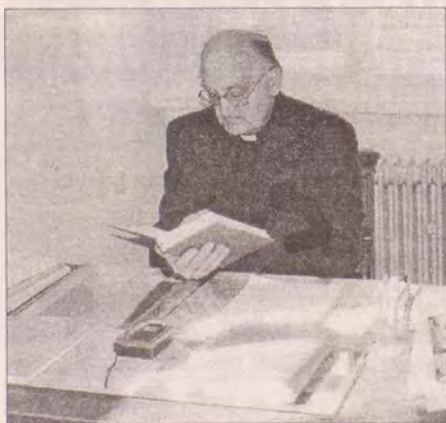
Otec generální ve své pracovně

Počítám-li v to i centrum mládeže, Charitu, vrátěného apod., je to asi 28 lidí. Je to poměrně velice málo oproti třeba Bambergu, kde mě generální vikář provázel