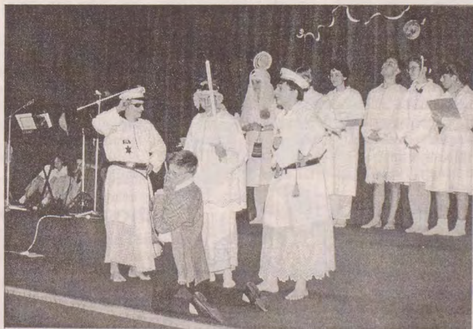
Nenapravitelný Krhounek u posledního soudu