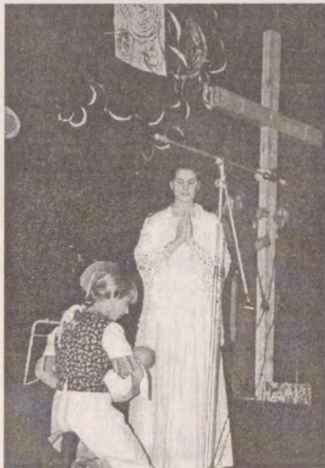
Sv. Zdislava v podání litoměřických

Přinášení darů se stává malou slavností - každá farnost si před mší připravila svůj obětní dar, který nyní přináší a s komentářem předává. Spolu s těmito dary je přinesena jako oběť také schránka s „kří-