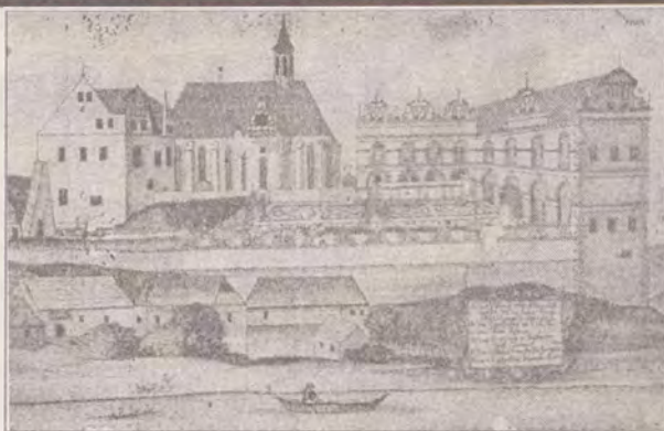
Původní gotický kostel na Dómském pahorku

Před 340 lety, dne 3.7. 1655 byla bulou papeže Alexandra VII. zřízena litoměřická diecéze, druhá nejstarší v Čechách (s výjimkou krátkého trvání litomyšlské diecéze 1344 - 1421). Litoměřická diecéze však navazuje na daleko starší tradice, jdoucí až do poloviny 11. století, kdy v Litoměřicích na „Hoře sv. Štěpána“ vznikla r. 1057 kolegiální kapitula.