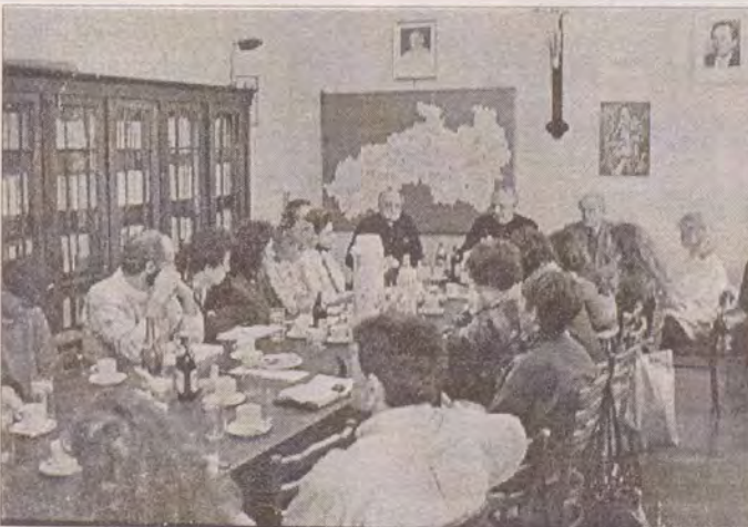
Ze setkání pastoračních asistentů s biskupem