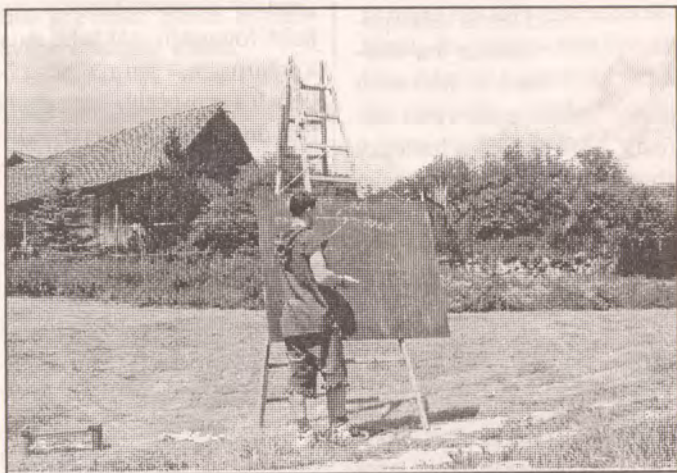
Na Schole je čas výuky ...

různých hábitů a kuten, na prsou připnutý rodový erb. Po snídani vyhlásí panoši slavnostní nástup - konečně všemu začínáme trochu rozumět.