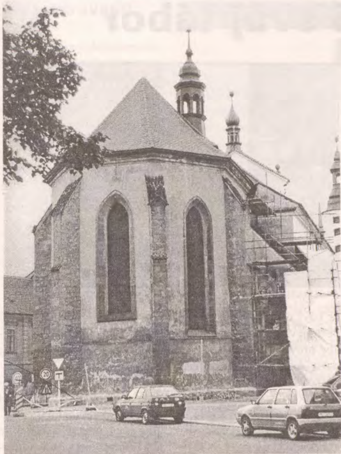
Arciděkanský kostel Nanebevzetí Panny Marie