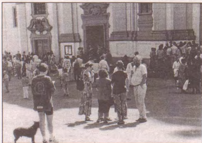
Poutníci po mši svatě před chrámem sv. Vavřince