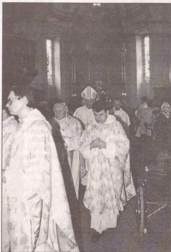
Provinciál dominikánů P. Duka přichází spolu s P. Helikarem a otcem biskupem (vzadu) k bohoslužbě

V sobotu byla sloužena ještě odpolední mše svatá, je-