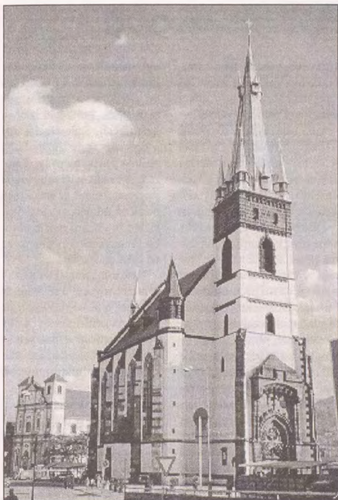
Kostel Nanevzetí Panny Marie v Ústí nad Labem