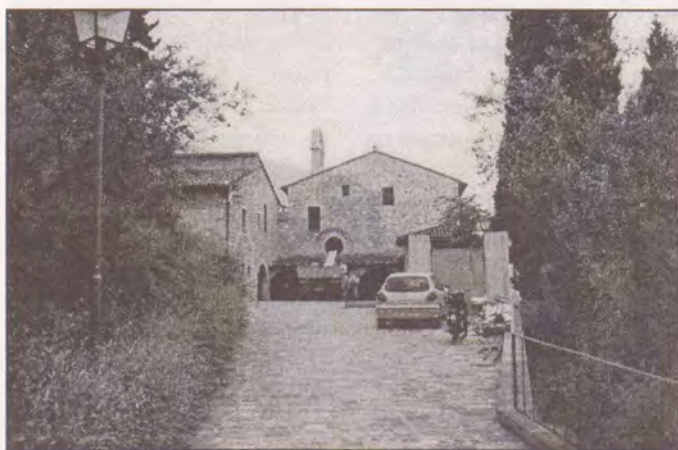
Kostel sv. Damiána v Assisi