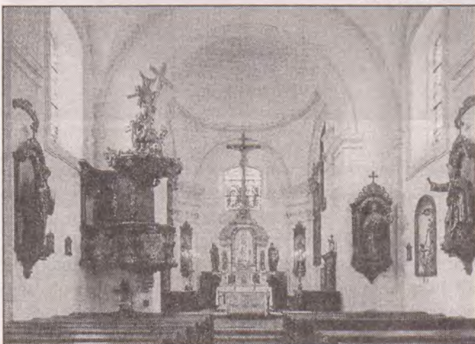
Interiér kostela v Mariánských Radčicích