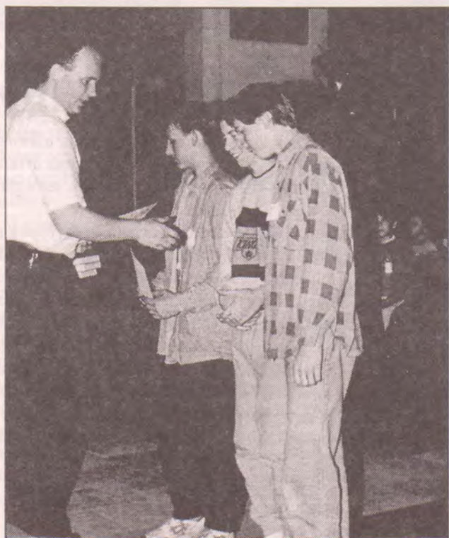
Foto vpravo dole: vítězné družstvo v kategorii seniorů z Hrádku nad Nisou