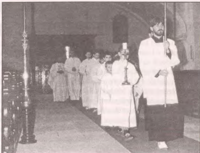
Foto vlevo nahoře: ministranti si i prakticky vyzkoušeli službu u oltáře