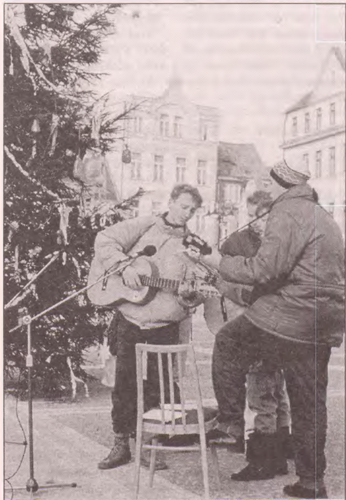
Českolipská mládež je opravdu aktivní