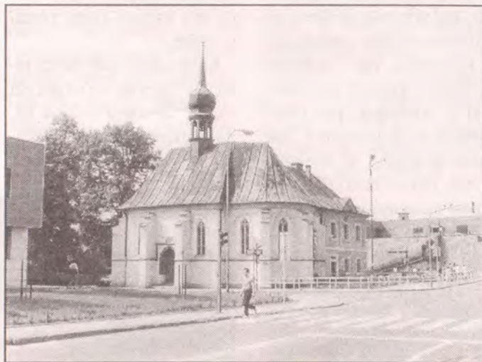
Kostel sv. Máří Magdalény

Českolipský farní obvod tvoří 12 farností s 13 kostely a několika kaplemi, které jsou většinou ve velmi špatném stavu. bohoslužby se kromě České Lípy konají pravidelně v Zákupech a ve Volfarticích; během léta též na Slunečné. Samotná Česká Lípa tvoří dvě farnosti: město a klášter, které jsou dnes spojeny personální unií (jsou spravovány jedním knězem). Město vlastně ani svůj farní kostel nemá,