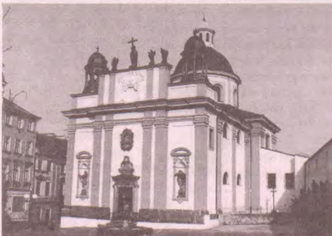
Kostel Povýšení sv. Kříže