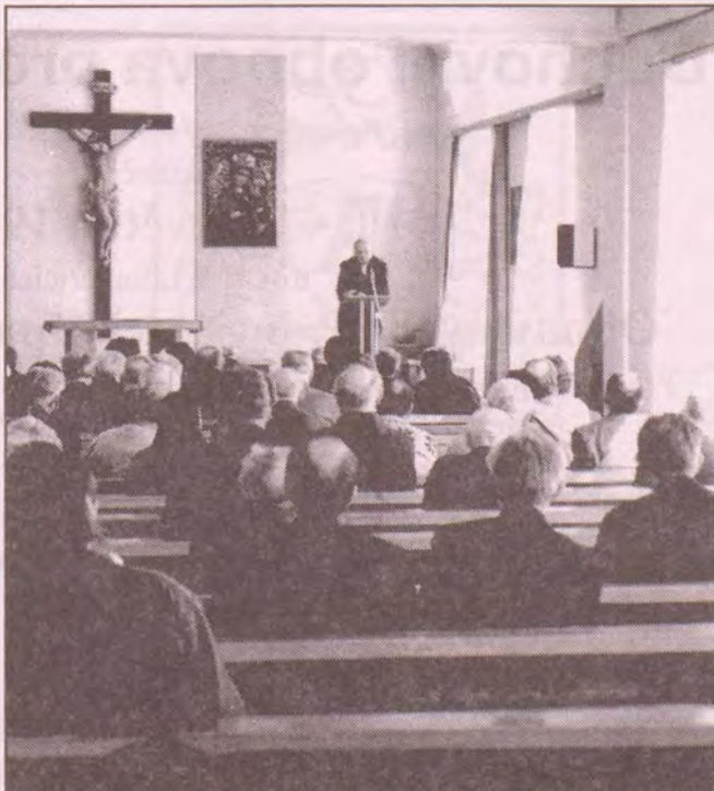
Záběr z besedy kněží s otcem biskupem

Zveme všechny na koncert v kostele sv. Antonína Paduánského v Liberci - Ruprechticích, který se koná