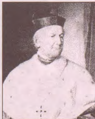
Biskup Vahala na dobové fotografii