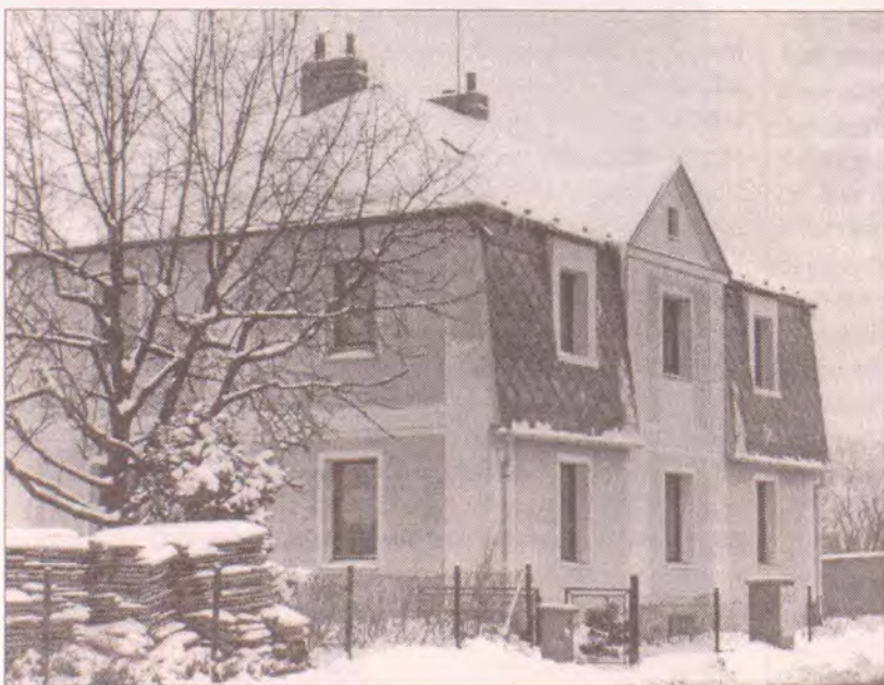
Dům františkánů v Liberci - Ruprechticích

Spiritualita je dána zakladatelem - sv. Františkem z As-