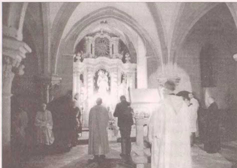
Obřad obláčky (přijetí do řádu) v kapitulní síni oseckého kláštera.