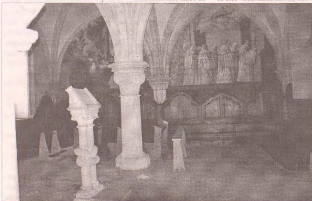
Kapitulní síň kláštera

a ten v prvních desetiletích 18. století vystavěl klášterní chrám Nanebevzetí Panny Marie