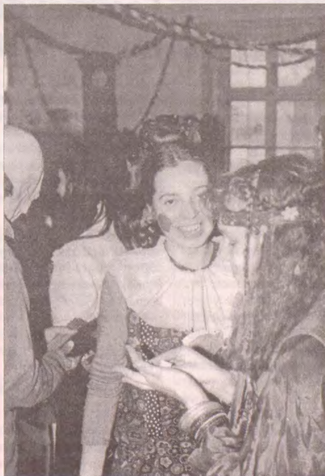
Ve Vratislavicích se sešla mládež z Liberecka na karneval

Otec generální vikář se zřetelem k příštímu setkání oznámil, že bude organizováno biskupstvím, bude včas oznámen program a pokud to jen trochu bude možné, setkání se zúčastní otec biskup osobně,