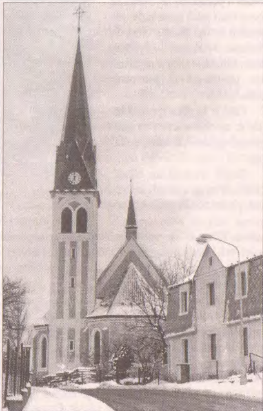
Ruprechtický kostel prošel v minulých letech celkovou opravou