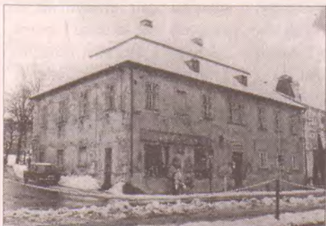
Budova památkové fary ve Vratislavicích