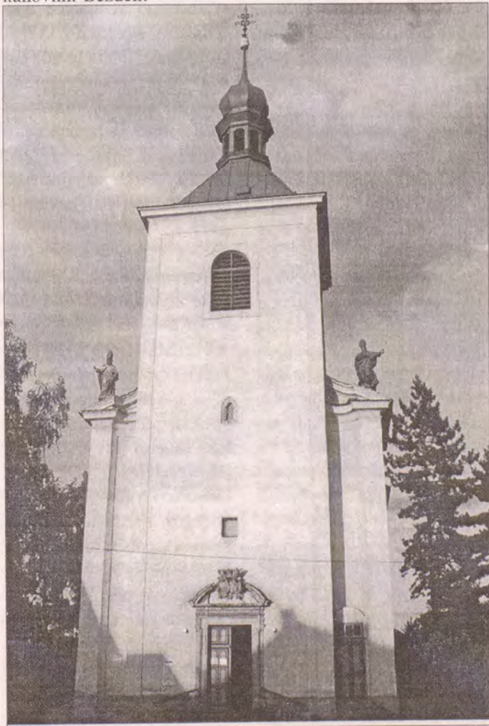
Kostel v Bohušovicích nad Ohří