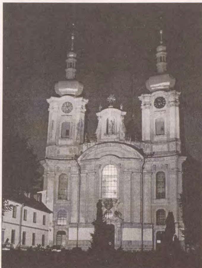
Hejnická mariánská bazilika, nalevo část kláštera

Téma je nasnadě - uplatnění II. vatikánského koncilu. Ve skutečnosti se prakticky neuplatnilo nic než dvě věci. První je liturgická reforma, a to ještě spíš jen tou vnější formou, druhou věcí je ustanovení biskupské konference. Strukturální reforma církve však ještě nenastala. Když se podíváte na partikulární právo, tak se nezměnilo ani v nejmenším. Časově to vypadá asi tak, že když se teď začíná intenzivně pracovat na přípravě sněmu, mohl by tyto otázky zpracovat a uzavřít zhruba kolem roku 2010 - 2015.