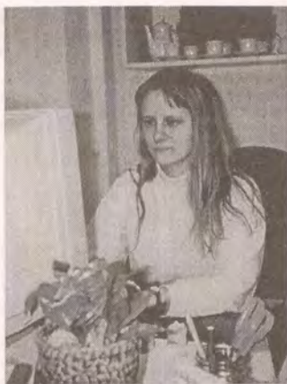
A další pohled na milé pracovnice v "Akváriu"

kud mohou, zavazují, že nám zaplatí „korunu denně pro Proglas“, což je ročně 365 Kč. Tady bych chtěla říci, že když budeme nyní vysílat se zvýšenými náklady, budeme potřebovat asi 1700 nových členů, kteří by toto zvýšení nákladů svými korunami denně pokryli.