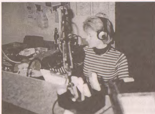
Odbavovací studio - místo, odkud se živě vstupuje do vysílání

Jsme si vědomi toho, že kvalitní zpravodajství je páteří každého rádia. Poněvadž jsme ze začátku nebyli schopni zajistit vlastní kvalitní zpravodajství (byla nás prostě jenom hrstka a neměli jsme žádné zkušenosti), rozhodli jsme se přebírat hodinová zpravodajství stanice BBC a Vatikánu. Dnes se již kromě toho snažíme získat zpravodajství vlastní, a to trojím způsobem. Jednak je to zpravodajství z náboženského světa, také je to zpravodajství z naší země a ze světa. Spolupracujeme pochybitelně s agenturami. Náboženské zprávy čerpáme z Ka-