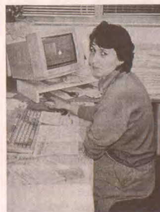
Tzv: Akvárium - kancelář, pro styk s veřejností, evidenci členů Klubu přátel Rádia Proglas...

thpress a překládáme je a ze zpráv ČBK - největší část ovšem od našich posluchačů. Ti nám posílají své zpravodaje, časopisy, e-mailovou poštou (Internetem), volají nám apod. Na územích, kde jsme slyšet, už máme své lidi, kteří nám posílají všechny důležité místní události. Co se týče politického zpravodajství, hledíme nahrazovat některé vstupy BBC vlastními zprávami, s tím počítáme také do nového vysílacího schématu. Toto nové schéma vysílání zavedeme právě v momentu, kdy začneme vysílat z Ještědu. Postupně budeme rozšiřovat počet svých spolupracovníků. Nyní máme namířeno do Hradce Králové a výhledově počítáme s pomocí našich posluchačů v těch vašich končinách. Byli bychom vděční každému, kdo je schopen psát nebo telefonovat... formulovat novinky, dát je do-