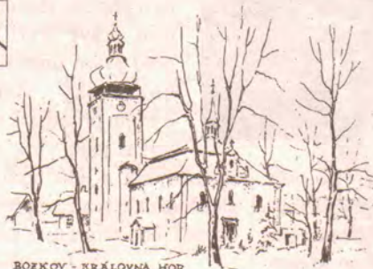
BOZKOV — KRÁLOVNA HOR