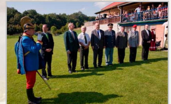
Slavnostní ukončení oficiální části programu na místním hřišti.

Další fotografie naleznete na adrese www.primatisk.net/Galerie , složka akce a události, složka Milešov.