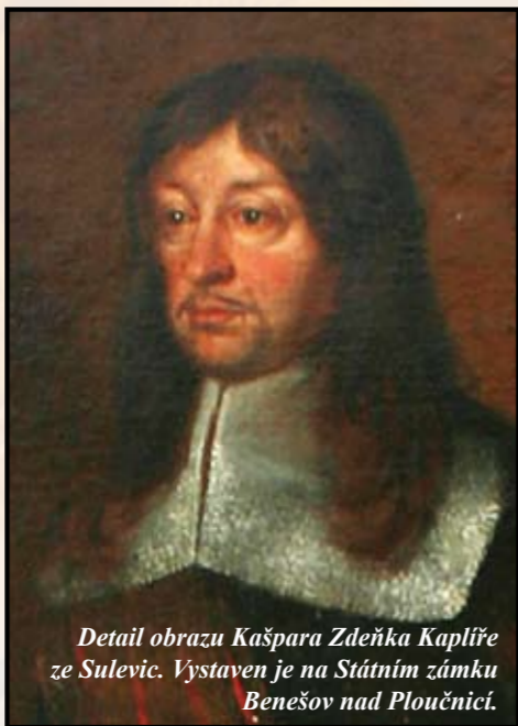
Detail obrazu Kašpara Zdeňka Kaplíře ze Sulevic. Vystaven je na Státním zámku Benešov nad Ploučnicí.

Stotisícová armáda osmanských Turků oblehla 14. července 1683 Vídeň, bránu do Evropy. Císař Leopold I. jmenoval dvaasedmdesátiletého českého šlechtice Kašpara Zdeňka Kaplíře ze Sulevic hlavním předsta-