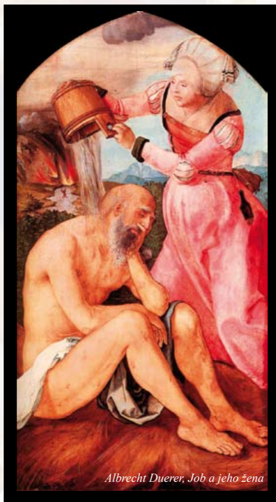
Albrecht Dürer, Job a jeho žena

samotný Bůh. Teologické a věroučné pravdy zde však ustupují do pozadí, svatopisec chce spíše zdůraznit dramatickosti příběhu a zároveň starou moudrost náboženského života „jako v nebi, tak i na zemi“. Události na zemi jsou v přímé závislosti na duchovním dění světa nadpřirozeného. Z tohoto důvodu není myslitelné, aby se na zemi dělo něco zásadního bez spolupůsobení nebes. A protože Bůh samozřejmě není zlomyslný, je nutné počítat s duchovní bytostí, která má za úkol cíleně vyhledávat chyby, špatné úmysly a hříchy lidí. Je zajímavé, jak je tato bytost ve své činnosti popisována: „šmejdi“ po celé zemi, aby našla co nejvíce nesrovnalostí, podezírání vše a každého, i dobré skutky obviňuje ze ziskovosti a zlořečení. Job je sice spravedlivý a zbožný, ale jak by nebyl, vždyť to dělá jen kvůli tomu, aby jej Bůh chránil v jeho pozemském blahobytu.