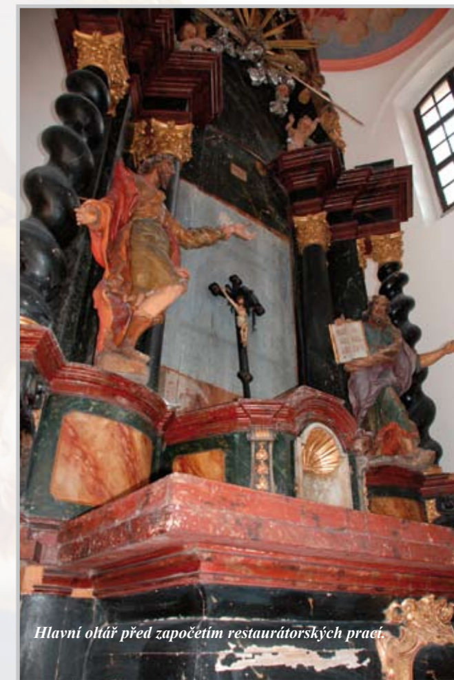
Hlavní oltář před započatím restaurátorských prací.