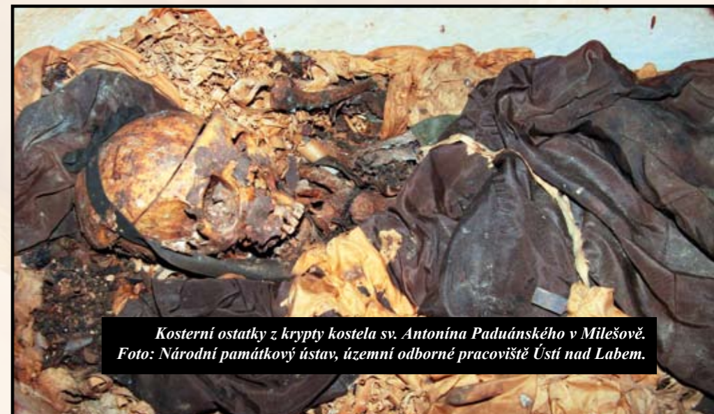
Kosterní ostatky z krypty kostela sv. Antonína Paduánského v Milešově.