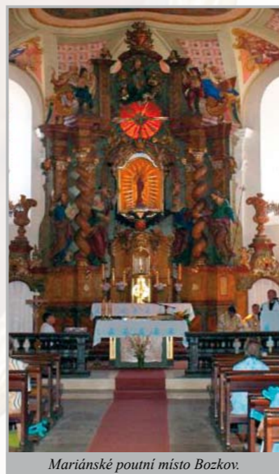
Mariánské poutní místo Bozkov.