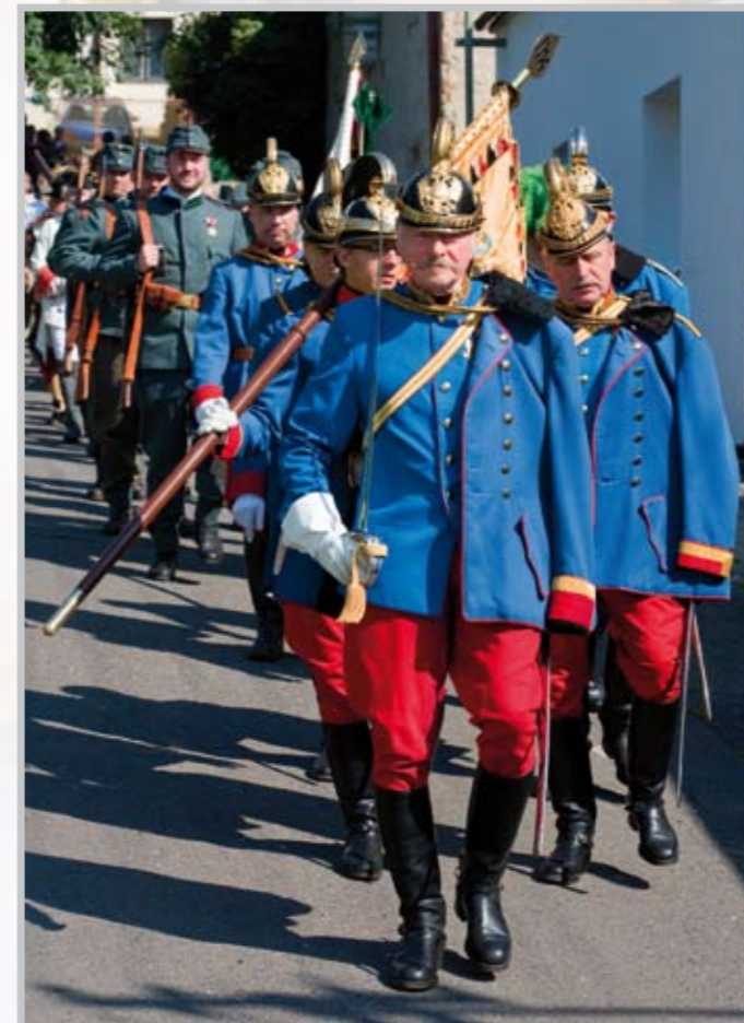
Původ historických regimentů od milešovského zámku ke kostelu.