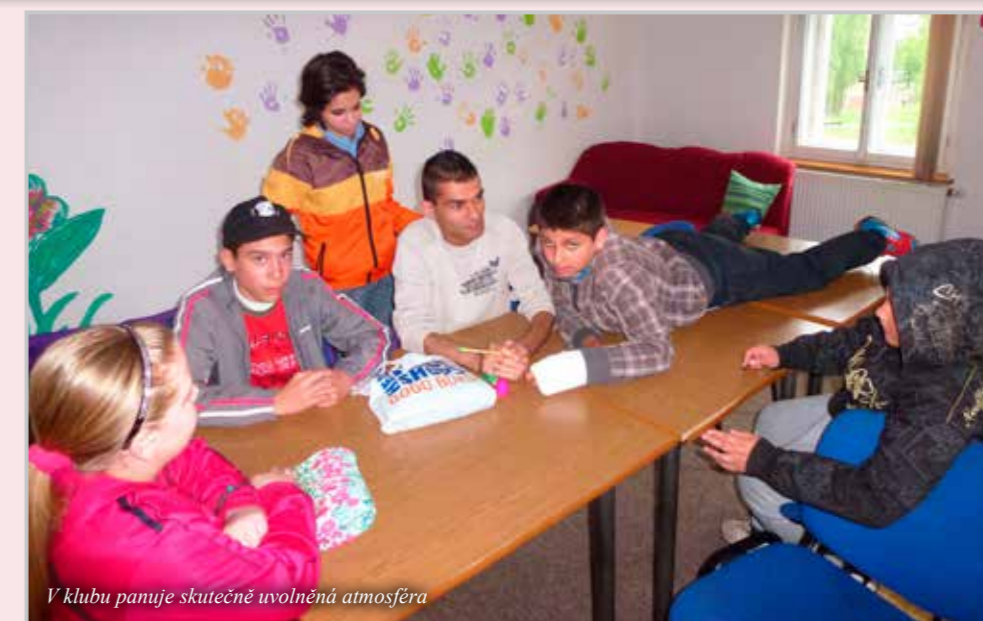
V klubu panuje skutečně uvolněná atmosféra

Světlušku pravidelně navštěvuje ko- lem třiceti dětí, ale vystřídal se jich zde již přes dvě stě. Některé děti