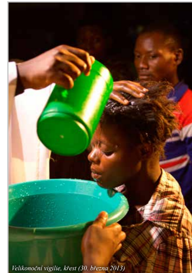
Velikonoční vigílie, křest (30. března 2013)

chodit všechny děti, nejen děti katolíků, pomáháme bez rozdílu vyznání. I my u nás můžeme dělat misijní činnost bez rozdílu vyznání: odpovědět na zájem o misie, pomoci lidem, cestování, touhu poznávat. Je to krásná příležitost pro pastorační činnost.