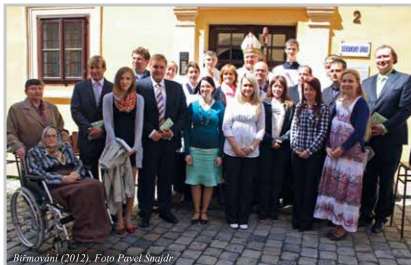
Bířmování (2012).

baže si nejsme jisti, zda my, páni faráři, nejsme po takovém týdnu více zničeni, než děti. Ale je to RADOST!