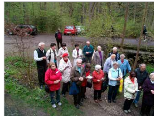
Žehnání pramene v Klokočce