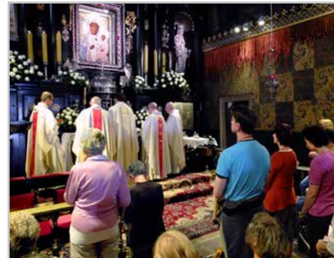
Polsko, na Jasně hoře v Czestochowe.