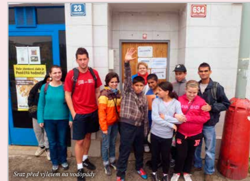
Sraz před výletem na vodopády

jen ony, to oceňují a dávají mi jasně najevo, že svou práci dělám dobře. Netvrdím, že je to vždy procházka růžovým sadem, ale vidět spokojené