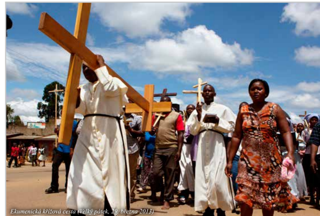
Ekumenická křížová cesta (Velký pátek, 29. března 2013)

co jsem v misiích, modlím se před jídlem jinak: vnímám, že v „dej těm, co nemají“ musí být moje spoluúčast, aktivita. Abychom nikdy nezapomínali na ty, co nemají co jíst. Od toho nás Pán Bůh má, jsme jeho nástroje. Jsou dvě věci, kterými mohu podpořit misie: modlitba a peníze. Bez modlitby to nejde, ale když se modlíme, tak nás modlitba nechá bez činů. Řešíme často hlouposti. Chtěl bych větší televizi, a můj bratr jí jednou za dva dny! I naše děti mají na nás různé požadavky. Když jim přiblížíte děti v misiích, tak se na život také