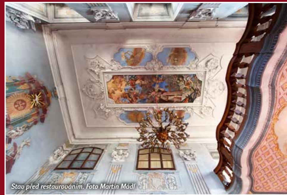
Stav před restaurováním.