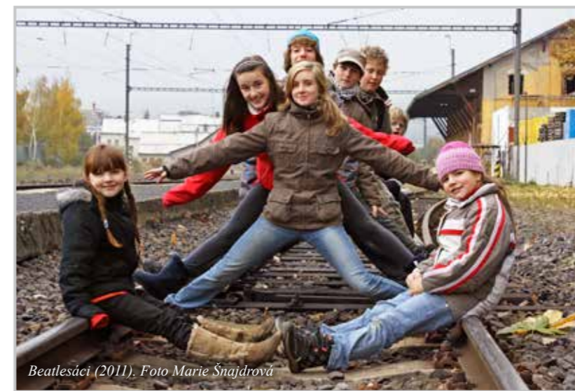
Beatlesáci (2011).