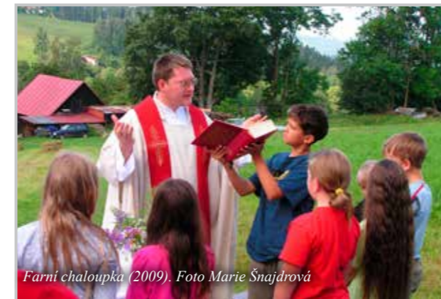
Farní chaloupka (2009).