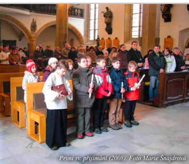
První sv. přijímání (2008).

Na samém počátku mi nejvíce byl nápomocen můj rodný bratr, který se vyzná ve stavebnictví. Držel jsem ho tu několik dní v kuse, dokud nebylo to nejnmutnější položeno, vydlážděno a postaveno. Nebyl na to rozhodně sám. Neohroženě se zapojila celá řada farníků: doktoři, učitelé, studenti, mládežníci, dokonce osobně a vlastnoručně i starosta obce Bílenců. Byl to fajn čas. Bratrance vytrhávali prohnílé obložení i celá futra, a díky mé babičce, která poslala z Moravy celou velkou krabici moravských koláčů, byla tato námaha, myslím, i velmi příjemná. Hned o prvních velkých prázdninách přijeli na pomoc také vysokoškoláci z Liberce, oklepávali jsme odpadávající omítku v děkanském kostele. Naštěstí jsem na vlastní přání dostal od svých příbuzných darem k primici dobrou výbavu nářadí.