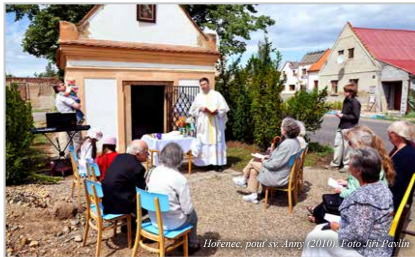
Hořenec, pouť sv. Anny (2010).

V průběhu všech těch prací jsem si povšiml, že je tady početná skupina malých dětí. A tak se mi vyloupila v hlavě myšlenka „Broučků“, programu pro nejmenší jedenkrát za 14 dní v nově zbudovaném farním klubu. Této aktivity se 21. listopadu 2003 chopila jedna maminka, MUDr. Alice Řehořková, které zpočátku pomáhaly Klárka, Bety,