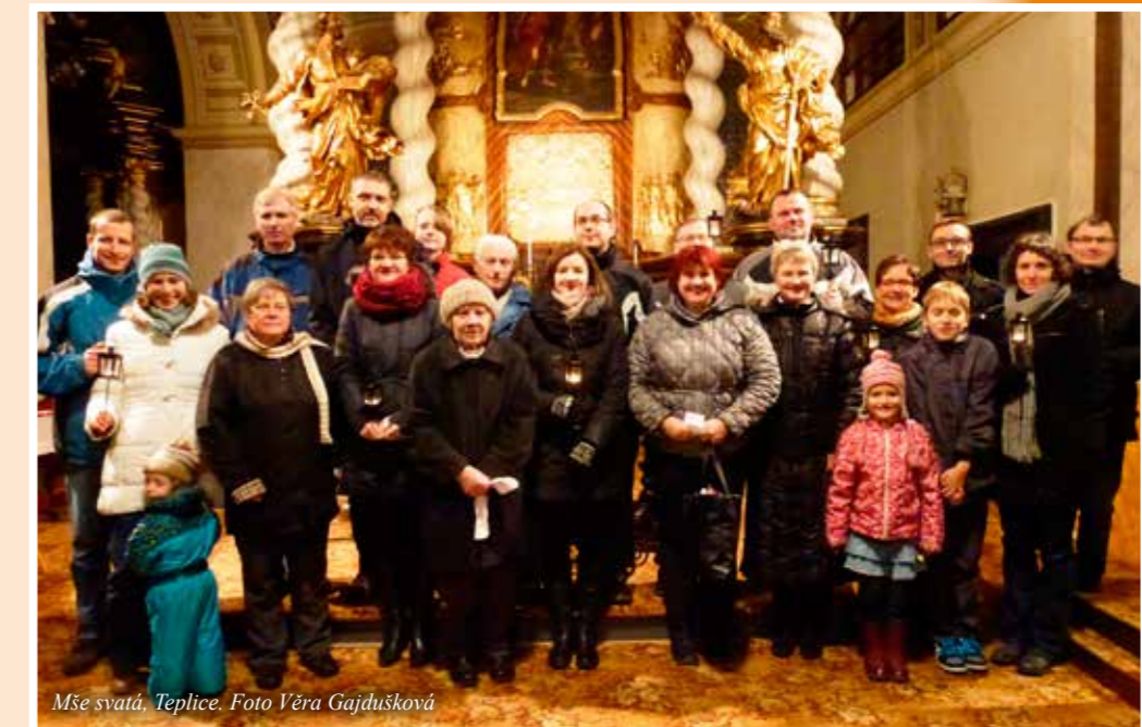
Mše svatá, Teplice.

Ze srdce vám všem přejeme, ať prožíváte co nejvíce radosti ve své rodině a jste si navzájem podporou.