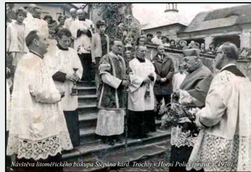
Návštěva litoměřického biskupa Štěpána kard. Trochty v Horní Polici (pravd. r. 1970).

Pak jsem nastoupil studium bohosloví v Brně. To bylo 1. října 1941. Otec spirituál, duchovní vůdce bohoslovců, nám řekl, že Pán Ježíš prolil všechnu svoji krev na kříži, ale stačila jediná kapka jeho krve, aby vykoupil celý svět. To mi utkvělo v paměti po celý život. Po celou tu dobu, mám už více jak 90 let, stále si tato slova vybavuji. Ve třetím semestru jsme museli narukovat. Nastoupit „Im Totaleinsatz“ v Německu. Cestou do Německa změnili náš cíl, který byl někde u Berlína, a vyložili nás v Mostě. První lágr, do kterého mě nastěhovali, byl 33 Růzodol. Tam jsem měl možnost dojíždět na mši svatou v neděli do Kopist, později do Mostu k minoritům. Místní duchovní k nám mluvil česky, tak nám to bylo moc milé. Na lágru jsem pracoval jednak něco jako uklízeč, a protože jsem uměl německy, tak jsem vyřizoval různé administrativní záležitosti. Pak následoval další lágr 22 v Dolním Jiřetíně. Tam byl kostel několik kroků od lágru, takže jsem mohl každý den být na mši svaté. Práci jsme začínali v 8 hodin, tak jsem ještě předtím mohl ministrovat místnímu knězi. To bylo moc krásné. Pak následoval lágr v Horním Litvínově a tam jsem byl až do konce války. Poblíž byly chemické továrny a rafinerie. Prodělali jsme tam mnoho amerických náletů továrny, museli jsme často prchat a zahynulo tam mnoho lidí.