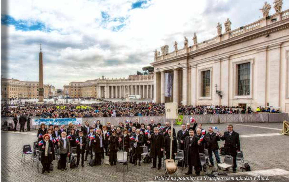
Pohled na poutníky na Svatopetrském náměstí v Římě.