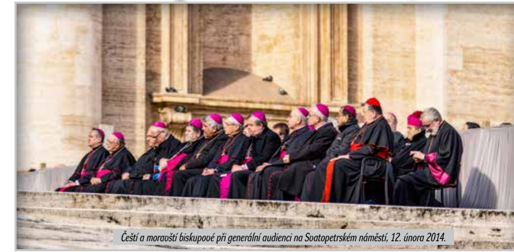
Čeští a moravští biskupové při generální audienci na Svatopetrském náměstí, 12. února 2014.