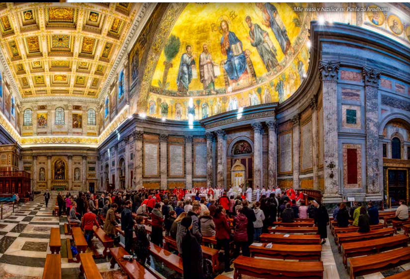
Mše svatá v bazilice sv. Pavla za hradbami

S využitím zpráv Ondřeje B. Mléčky, tiskové středisko ČBK • www.cirkev.cz