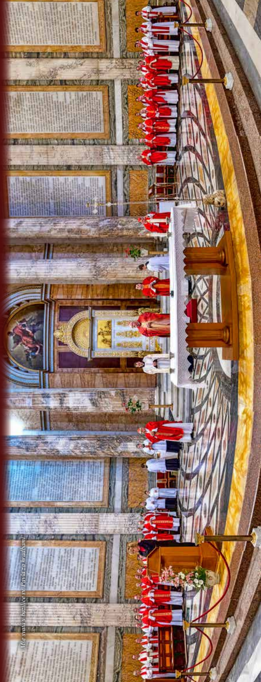
Mše svatá v bazilice sv. Pavla za hradbami

Jako dárek jsem původně chtěl dát Svatému otci přátelskou soupravu z porcelánu - cibulák z naší diecéze, z Dubí, ale nakonec jsme mu na závěr setkání předali společný dar - kopii Palladia země české ze Staré Boleslavi.