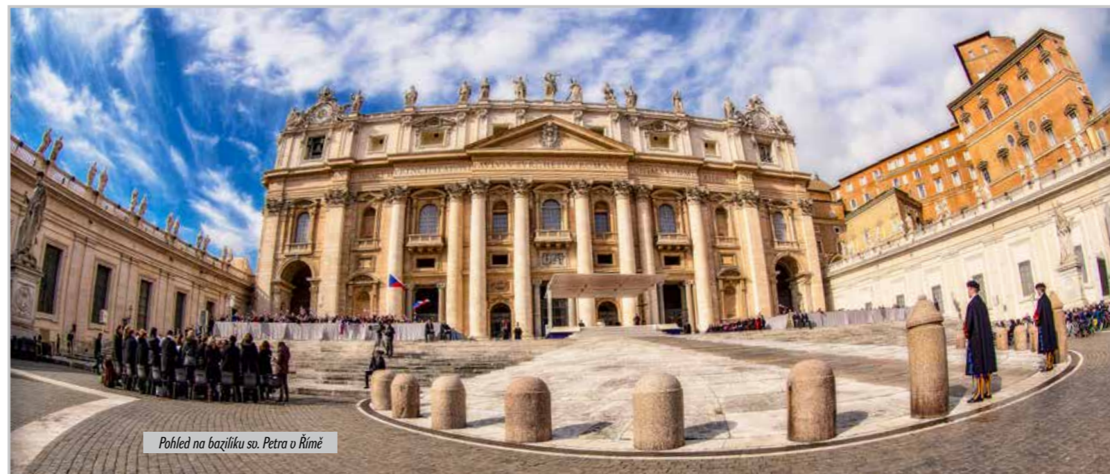
Pohled na baziliku sv. Petra v Římě