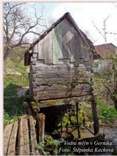
Vodní mlýn v Gerníku.

soutěskou do města Oršova. Cestou okolo Dunaje překonáváme spadané kamení na silnici, které se zřítilo a nikdo ho neodklidil, protože je svátek (pravoslavní slaví Velikonoce později). Projíždíme okolo skalní bysty dáckého vůdce Decebala a obdivujeme ma-