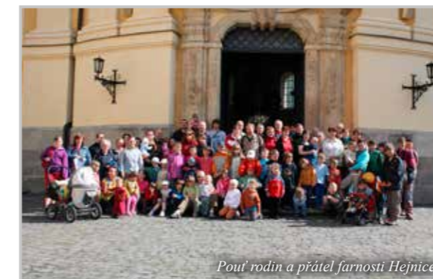
Pouť rodin a přátel farnosti Hejnice

„Z čeho však máme největší radost, je každoroční pěší pouť rodin a přátel farnosti. Ano,