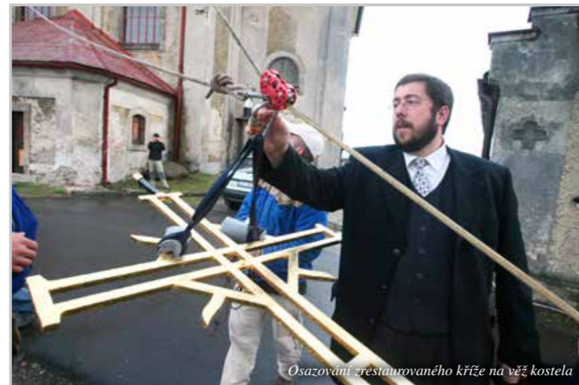
Osazování zrestaurovaného kříže na věž kostela