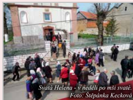
Svatá Helena - v neděli po mši svaté.

Přes Slovensko a Maďarsko cesta ubíhala rychle, rumunské hranice jsme překročili nad ránem. Vítila nás probouzející se země, kde rozkvétaly stromy a voněly květy. Po příjezdu nás krajané vřele přivítali, a protože byla neděle, pozvali i ke slavení mše svaté. O místní kostel se vzorně stará kostelník, pečlivě vše přichystá a čeká na příjezd kněze. V současné době zde slouží rumunský kněz, který se velmi snaží o přiblížení se místní české komunitě a část mše svaté celebruje v češtině. Spánek nám cestou nebyl dopřán, a tak pro nás bylo těžké udržet oči otevřené a nenechat padnout hlavu o lavici ☹. Neděle je zde tou pravou nedělí. Muži si obléknou černý oblek s bílou košilí, ženy sváteční sukni nebo kroj a celá vesnice jde na mši svatou. Po ní se muži potkají v místním všeúčelovém zařízení pana Štěpničky na stopičku likéru, poklábosí a rozejdou se ke svým rodinám na nedělní oběd. Odpoledne se všichni navštěvují a odpočívají. Jediná práce, kterou zde v neděli vykonávají, je starost o dobytek. Ve většině chalup mají stádečko koz, oveček nebo i kravky, z jejichž mléka ženy vyrábějí výborné sýry.