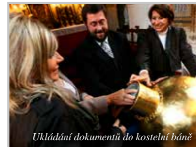
Ukládání dokumentů do kostelní bány

a to třeba i z toho důvodu, že jsem se jako místní duchovní a zároveň jako zdejší občan stal řádně zvoleným zastupitelem obce. Tím je do jisté míry obec s farností vzájemně propojená,“ říká. „Spolupráci farnosti a zdejšího komunitního života pokládám za velice důležitou, proto se farnost stala členem místního spolku MOST 2012. Aktivně spolupracujeme s místní základní školou a s její paní ředitelkou, a v neposlední řadě i s místními dobrovolnými hasiči. Důležité však je, abychom jako farnost byli i my pro druhé dobrým partnerem, a to i přesto, že zůstaneme