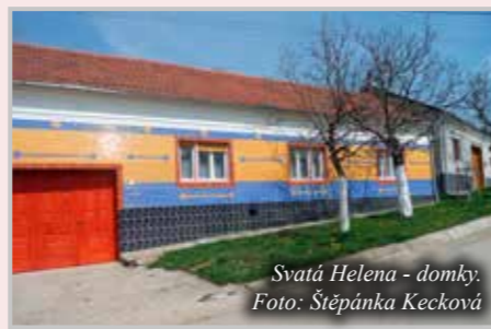
Svatá Helena - domky.

Pondělní den začal modlitbou, výtečnou snídaní od paní Marienky a plánováním zpáteční cesty. Po rozloučení a příslibu, že se neloučíme nadlouho, vyjždíme Kazanskou