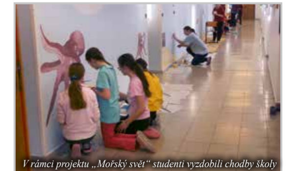
V rámci projektu „Mořský svět“ studenti vyzdobili chodbu školy

Myšlenka udržitelného rozvoje a „zodpovědnosti péče o společný domov, naši planetu“ se prolíná všemi stupni našeho vzdělávacího programu, zejména v předmětech environmentální výchova, prvouka, přírodopis, biologie. V příštím školním roce plánujeme integrovat myšlenky a podněty Svatého otce obsažené v encyklice i do předmětů etická výchova a religionistika.