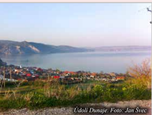
Údolí Dunaje.

Naše cesta začala v sobotu 11. dubna po poledni v České Kamenici. Společně s kolegy jsme nasadili do auta plného potravinové pomoci, základních léků a inkontinenčních pomůcek. Na darování potravin se podíleli všichni ti, kteří se zapojili do listopadové potravinové sbírky v prodejních Penny Česká Kamenice a Globus Ústí nad Labem.