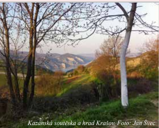
Kazanská soutěska a hrad Krašov.

V oblasti rumunského Banátu je vysoká nezaměstnanost, což je příčinou odlivu mladých lidí. Ve vesnicích tak zůstávají převážně starší lidé, kteří se s přibývajícím věkem nedokáží o sebe dostačujícím způsobem postarat. Hodonínská Charita už před lety přišla s nápadem pomoci a ve spolupráci s Charitou v Temešváru nastartovala projekt pečovatelské služby v jednotlivých českých vesnicích,