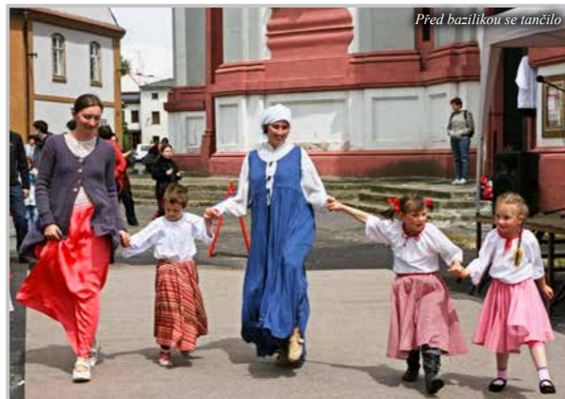
Před bazilikou se tančilo