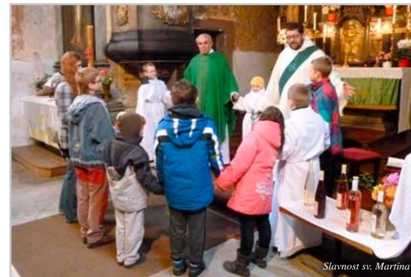
Slavnost sv. Martina