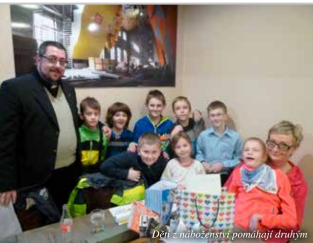
Děti z náboženství pomáhají druhým

Aktivít dlouhomostecké farnosti je ale celá řada: víkendy pro děti, sbor, benefiční koncerty, tříkrálové žehnání domů a samozřejmě také výuka náboženství. Ta probíhá ve dvou skupinách rozdělených podle věku, ve třetí skupině se děti připravují na první svatě přijímání.