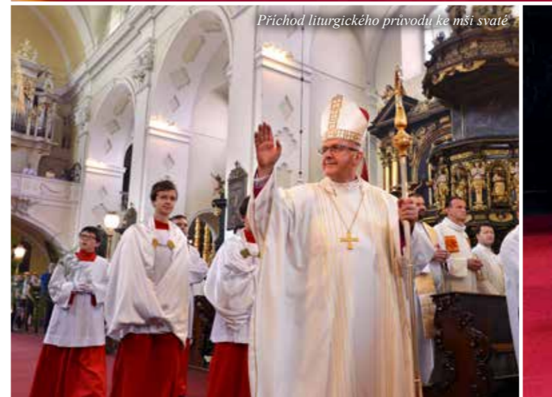
Příchod liturgického průvodu ke mši svaté