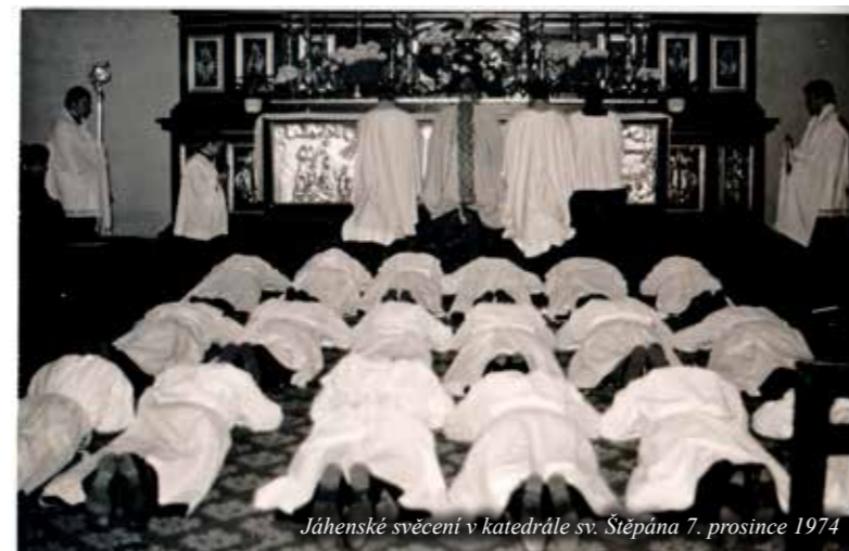
Jáhenské svěcení v katedrále sv. Štěpána 7. prosince 1974

Jako novokněz jsem se stal kaplanem na děkanství v Litoměřicích.