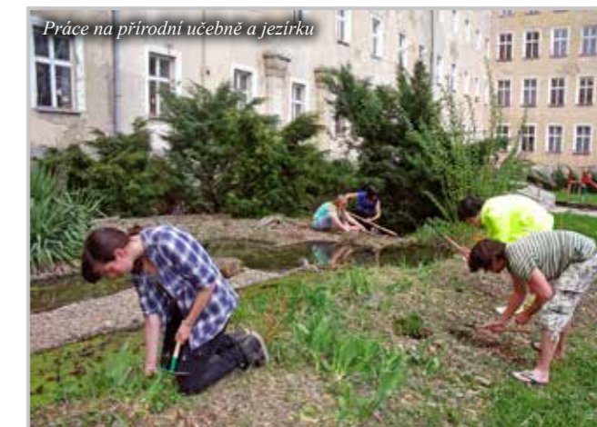
Práce na přírodní učebně a jezírku