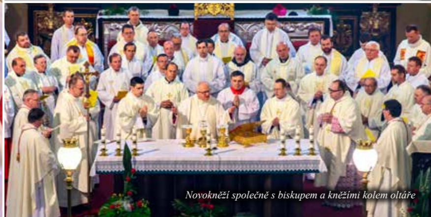
Vzkládání rukou biskupa