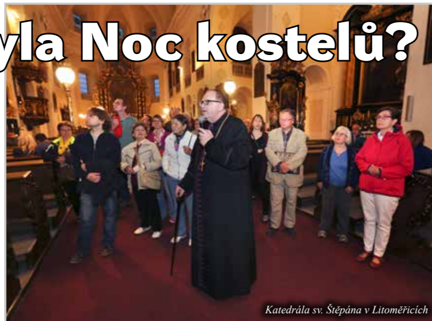
Katedrála sv. Štěpána v Litoměřicích

Letošní Noc kostelů se vydařila – zní to jako klišé, ale snad je to tak... Nasvědčuje tomu počet návštěvníků i dojmy, které jsme stačili během Noci kostelů zachytit. V kostelích vládla neopakovatelná atmosféra. Ten večer se neotevíraly jen kostely, ale i srdce, nás, kteří jsme chtěli dát, nabídnout, pozvat, ale i přichozích, kteří naslouchali, přijímali to, co jsme se snažili pro ten večer přichystat. Ať již to byla vystoupení sborů, dramatická vystoupení, varhanní hud-