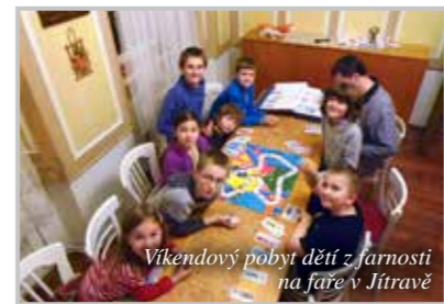
Víkendový pobyt dětí z farnosti na jaře v Jitřavě