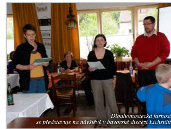
Dlouhomostecká farnost se představuje na návštěvě v bavorské diecézi Eichstätt

Česko-německé vztahy jsou pro farnost ležící v bývalých Sudetech velice důležité, a to nejen ve vztahu k naší minulosti, ale také s ohledem na budoucnost. „Osobně jsem mohl poznat, jak moc je nutné vzájemné odpuštění a společná snaha o nové přítomné partnerství. Již pět let se naše farnost intenzivně podílí na budování těchto vztahů, zvláště s naší partnerskou diecézí Eichstätt. Měli jsme možnost dvakrát pozvat její zástupce a farníky k nám do naší farnosti, jednou jsme byli požádáni zase my, abychom představili v Německu naši malou farnost,“ připomíná