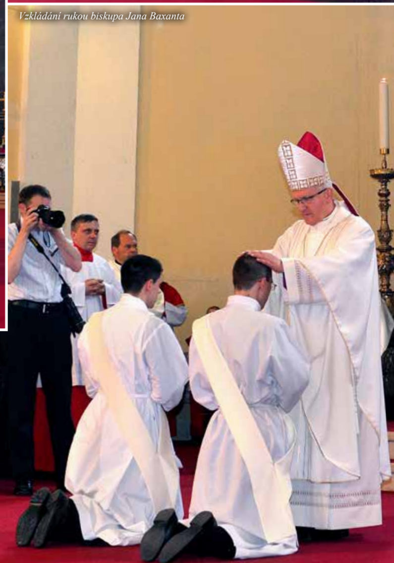
Vkládání rukou biskupa Jana Baxanta