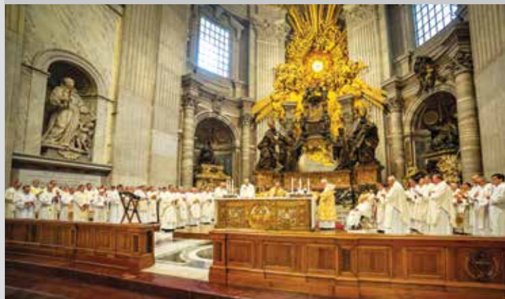
Hlavní bohoslužba v bazilice sv. Petra v Římě