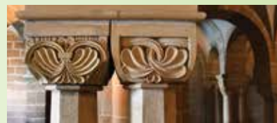
Kryptu charakterizují řady románských sloupků zdobených rostlinnými a zvířecími motivy.

Kostel Narození Panny Marie, který je součástí areálu kláštera, byl původně románskou bazilikou. Současný chrám pochází z období barokní přestavby v letech 1710–1720. Je založen na půdorysu latinského kříže, kterému dominuje výrazná kupole, dílo T. Haffeneckera. V západním průčelí se nacházejí dvě čtyřboké věže. Na hlavní osu chrámu navazují boční ramena příčné lodi s rozměrnými apsidami. V osách apsid se dochovala původní úzká okna s bohatě profilovaným ostěním. Součástí kostela je unikátní románská krypta z počátku 13. stol., kde spočívají mj. ostatky zakladatelky kláštera, Gertrudy Babenberské.