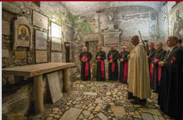
Společná modlitba biskupů v bazilice sv. Klimenta u hrobu sv. Cyrila

Koncert chval Scholy brněnské mládeže (SBM) v kostele sv. Marcelína a Petra v Lateránu.