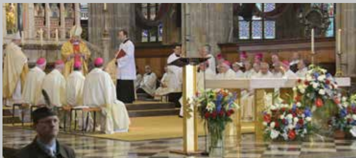
Bohoslužba v katedrále sv. Víta, Václava a Vojtěcha na Pražském hradě