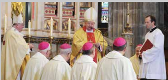
Stanisław kardinál Dziwisz, emeritní krakovský arcibiskup v pražské katedrále