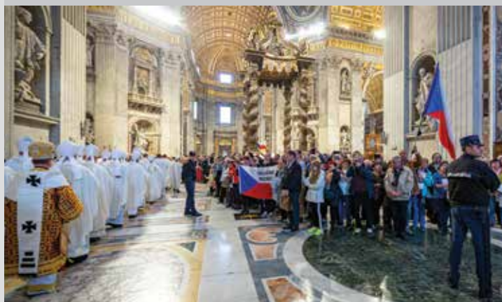
Hlavní bohoslužba národní pouti ve svatopetrské bazilice