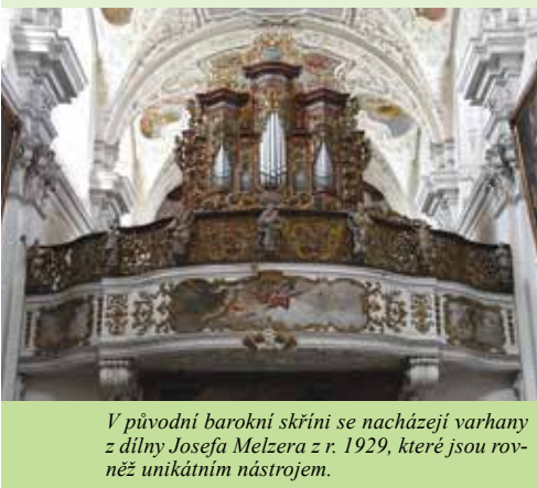
V původní barokní skříni se nacházejí varhany z dílny Josefa Melzera z r. 1929, které jsou rovněž unikátním nástrojem.

Krpeš, Václav: Historie Doksán . Dostupné z: obec-doksany.cz Doksany - Klášter premonstrátek. Dostupné z: kralovskedilo.ktf.cuni.cz Národní památkový ústav: Doksany – klášter a zámek. Dostupné z: npu.cz/sights/klaster-doksany Pamatkovykatalog.cz