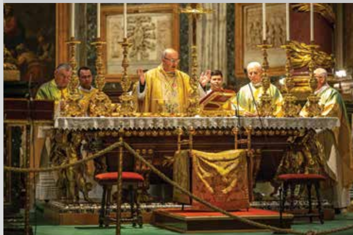
Zahájení národní pouti v bazilice Santa Maria Maggiore