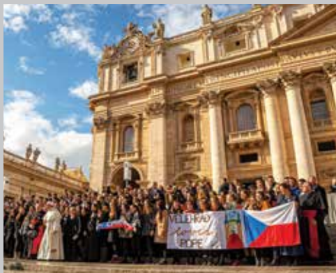
Audience u Svatého otce Františka