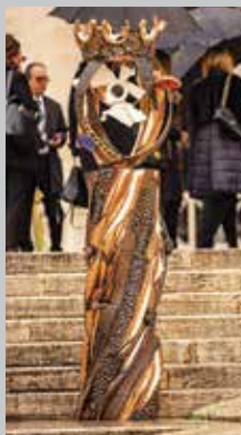
Socha Koruna sv. Anežky České