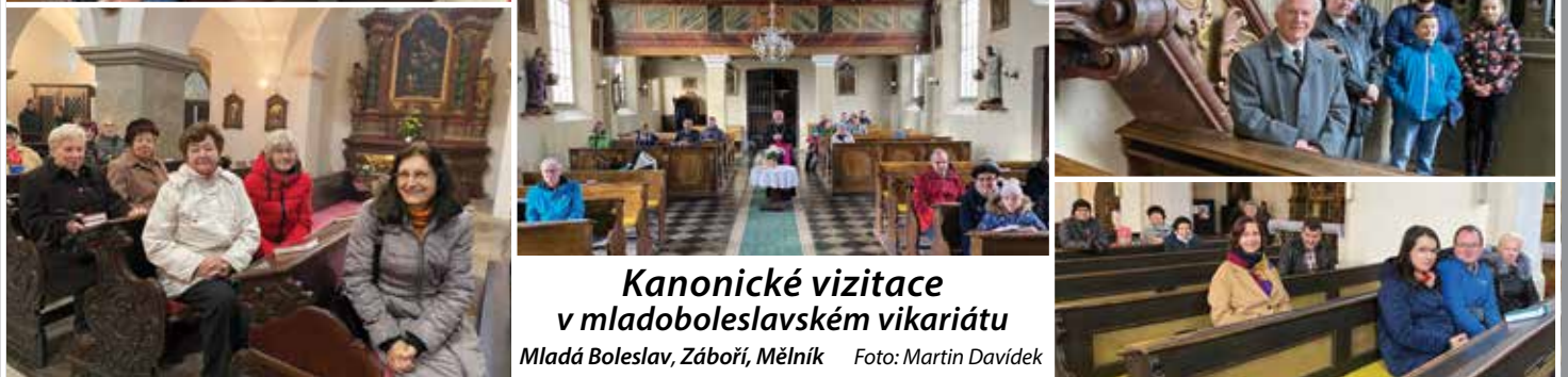
Kanonické vizitace v mladoboleslavském vikariátu Mladá Boleslav, Záboří, Mělník