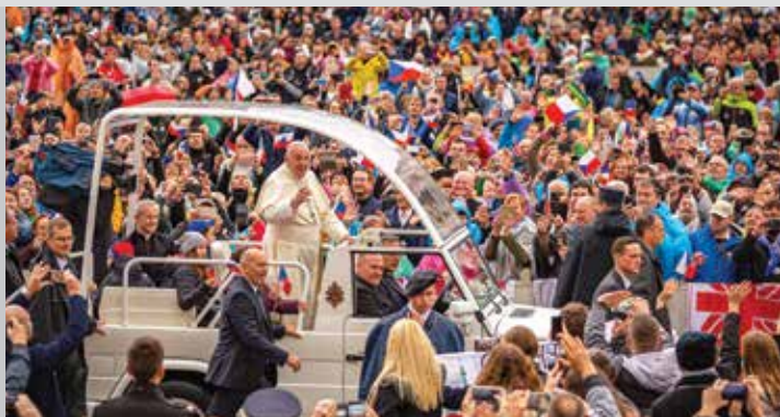
Poutníci z České republiky při setkání se Svatým otcem