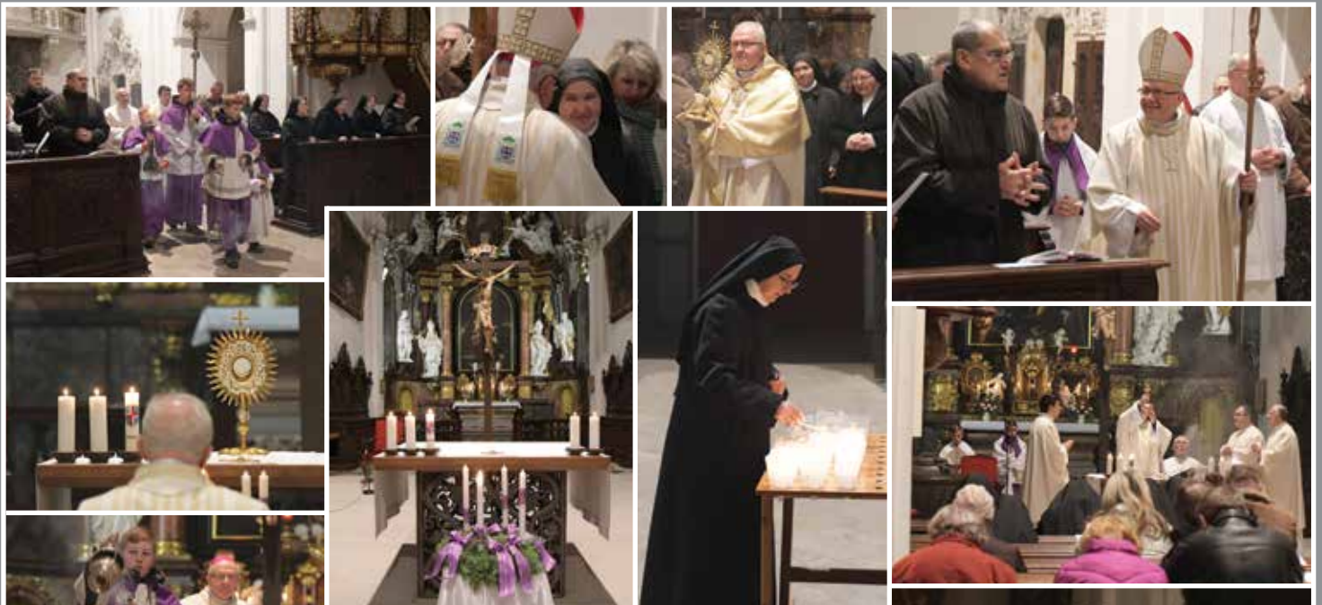
Pouť za kněžská a řeholní povolání v Doksanech 6. prosince 2019