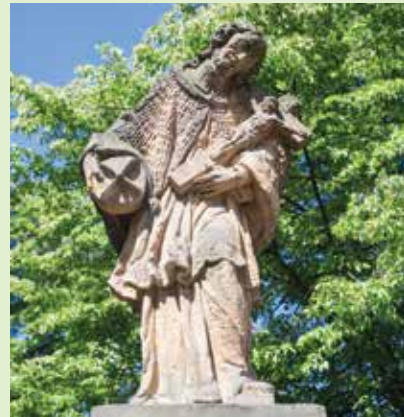
Socha sv. Jana Nepomuckého na západním parapetu mostku sem byla přemístěna ze zbořených Holešic a představuje jednu z mála dochovaných hmotných památek na tuto obec.

Toto privilegium potvrdil r. 1858 i papež Pius IX. Kostel je dlouhý 63 kroků, neboť Panna Marie se podle tradice dožila 63 let. Ambity mají otevřené arkády, které nese 36 sloupů, a jejich stěny a stropy jsou zdobeny výjevy z mariánské legendy i z četných uzdravení díky zdejší milostné soše.