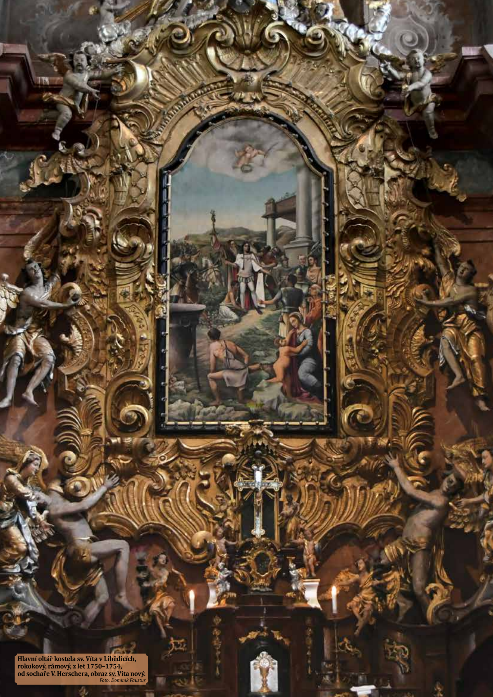
Hlavní oltář kostela sv. Víta v Liběčicích, rokokový, rámový, z let 1750–1754, od sochaře V. Herschera, obraz sv. Víta nový.