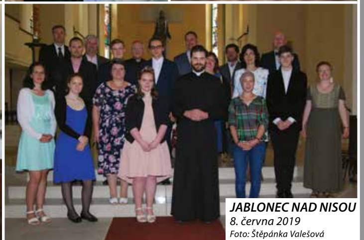
JABLONEC NAD NISOU 8. června 2019