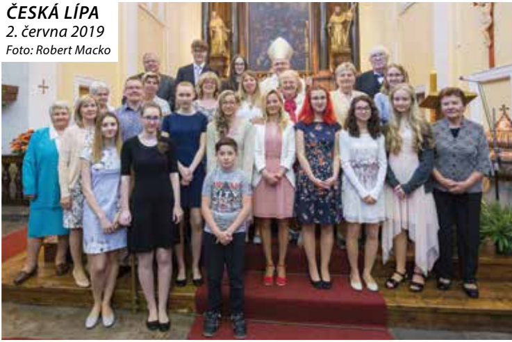
ČESKÁ LÍPA 2. června 2019