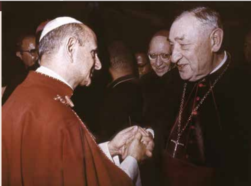
Papež Pavel VI. blahopřeje Trochtovi k získání kardinálské hodnosti