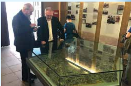
Muzeum bombardování Würzburgu (model poničeného města)