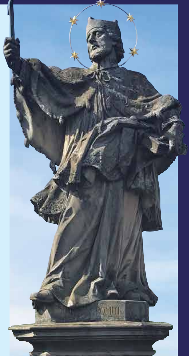
SV. JANE NEPOMUCKÝ, ORODUJ ZA NÁS.

Dva muži, dva posmrtné osudy. Jeden na počátku významný se stal bezvýznamným, zatímco dru-