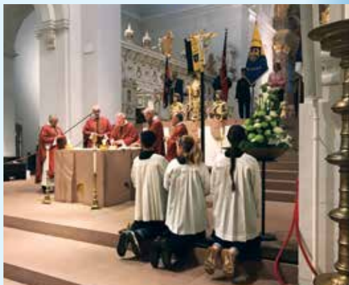
Mše svatá v kostele sv. Jana Evangelisty a sv. Jana Křtitele