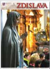
Na obálce: Noc kostelů 2019