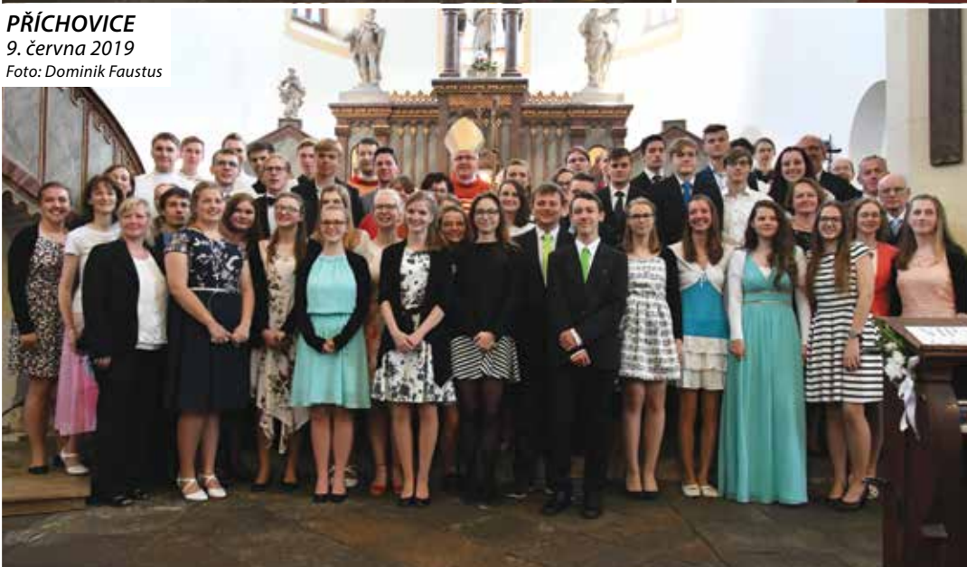
PŘÍCHOVICE 9. června 2019