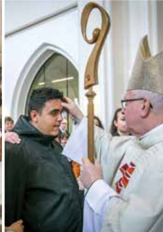
TEPLICE-TRNOVANY 26. května 2019