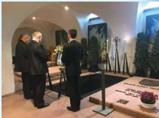
U hrobu würzburgského biskupa Paula-Wemera Scheeleho