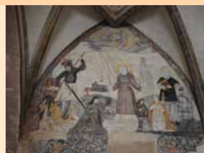
Stigmatizace sv. Františka, jižní loď kostela

Informace o akcích naleznete na: http://kultura-kadan.cz/muzeum/pobocka/158/frantiskansky-klaster