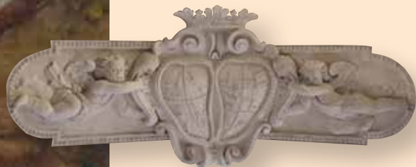
Ukázka stropního štku v kapli sv. Antonína Paduánského

Jižní loď kostela je již hotová a podoba kostela se tím postupně navrácí k výmalbě z roku 1614.