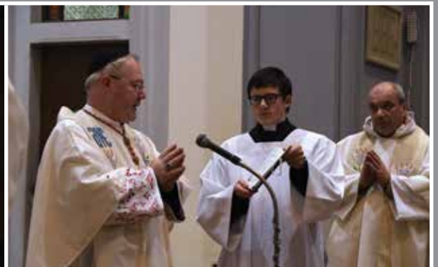
Filipovská pouť 2019 12.–13. ledna 2019