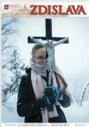
Na obálce: Panama víkend v centru mládeže Křížovatka v Přířichovicích