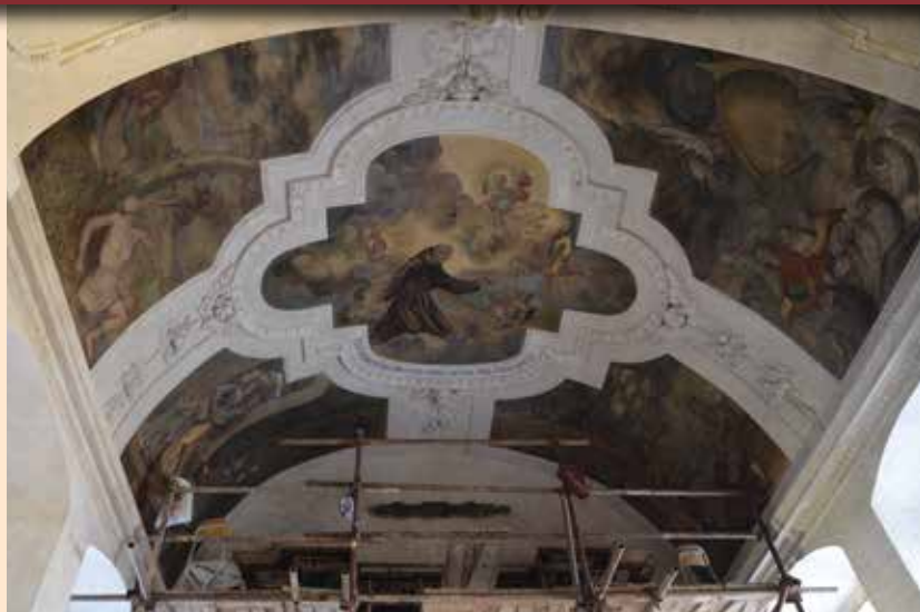
Stropní malba v kapli sv. Antonína Paduánského

Na některých místech jsou však viditelné i fragmenty maleb ze století 15., 16. a 17.