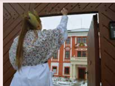
Tři králové přišli na koledu také na litoměřické biskupství za Mons. Baxantem