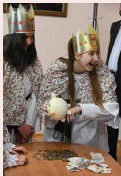
Na konzistoři na Dómském náměstí bylo pro koledníky přichystáno tradiční prasátko