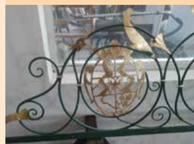
Část mříže - kaple sv. Antonína Paduánského