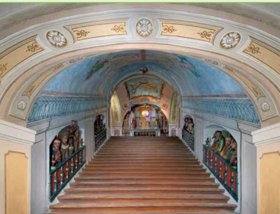
Poutní kaple Svatých schodů