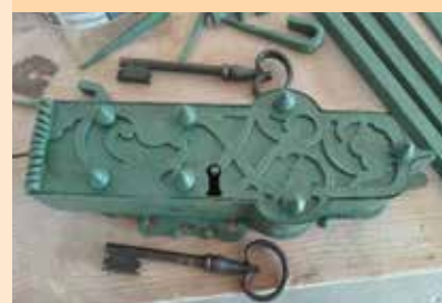
Zámek z mříže - kaple sv. Anton. Paduánského