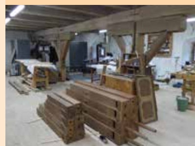
Náhled do restaurátorských dílen - varhany