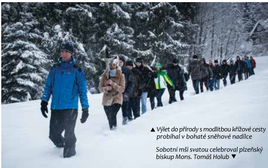
▲ Výlet do přírody s modlitbou křížové cesty probíhal v bohaté sněhové nadílce